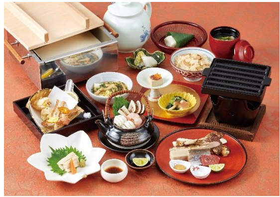
松茸ざんまい～薫かおり～

初めての試みとなる経営幹部が参加する公開試食会及び懇親会は、株主の皆様のご意見を今後の経営に活かし「企業価値向上」へ繋げることを目的とし、九州・関西・関東の3地区で年2回（計6回）の開催を予定しております。